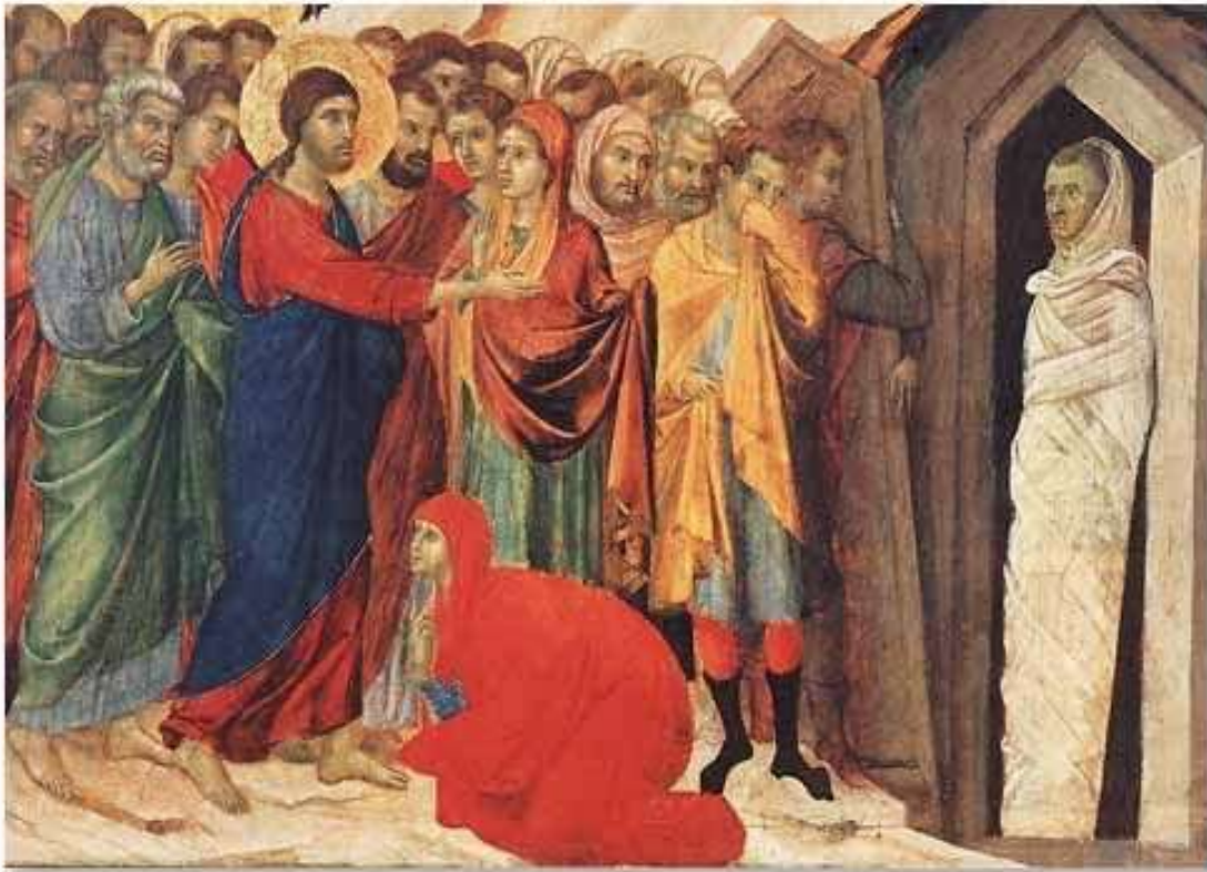
Duccio de Buoninsegna